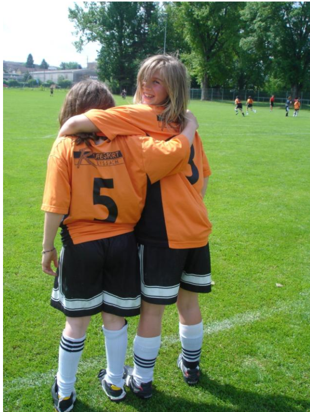
Team „Blue Panthers“ aus Utzenstorf, fusbelle 2010 in Biel

Nadja Forster Jugendarbeit Region Fraubrunnen 076 576 42 64 / nadja.forster@jafnet.ch